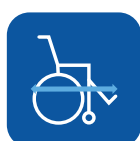
Totallængde inkl. benstøtter ▼