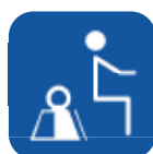
Max. brugervægt ▼