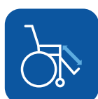
Benstøtte- længde ▼