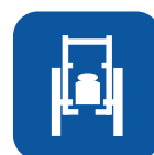
Totalvægt fra ▼