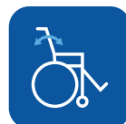
Ryg vinkel ▼