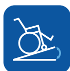
Max. sikker vejrhældning ▼