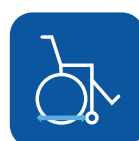
Totallængde uden benstøtter ▼