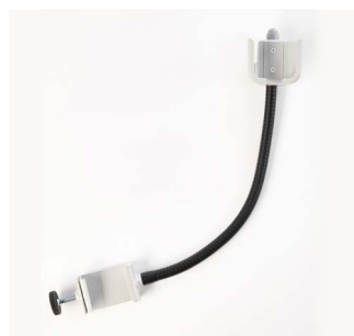
Holder til håndbetjening

Anvendes for at dække siden, når sengen er forlænget